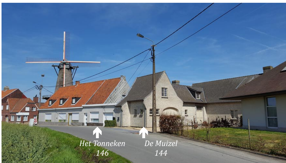
Café Het Tonneken nu: middelste huisje met witte garagepoort . Café De Muizel stond waar nu de nieuwbouw staat - in het midden van de foto.