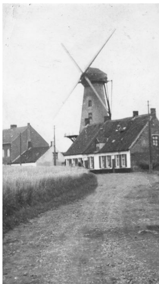
Op deze foto is Café De Muizel al afgebroken.